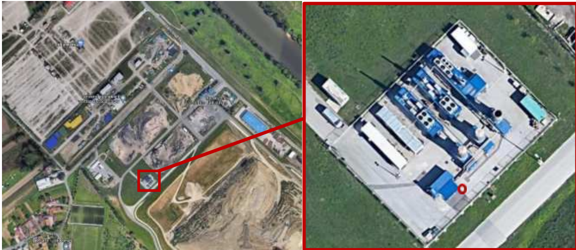
Slika 2. Mjerno mjesto na Odlagalištu otpada Jakuševac